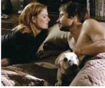
UNTYPISCH? David Duchovny spielt in „Californication“ einen Sexsüchtigen

„Die Bilder vom peniszentrierten Rammler, sexbeses- sen und egoistisch, sind realitätsferne Kränkungen“