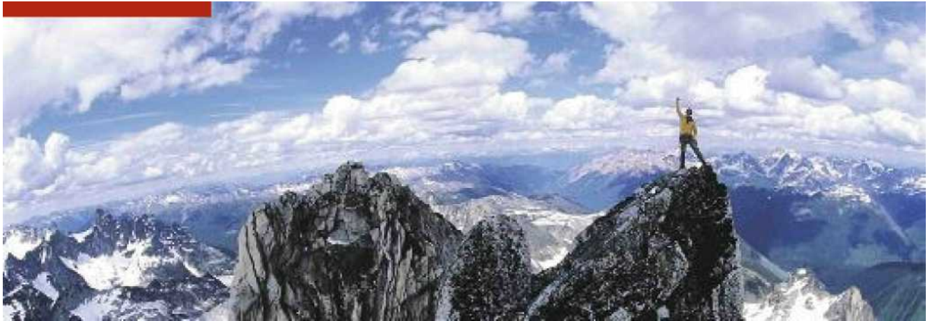
DAS IST DER GIPFEL! Die Herren der Schöpfung befinden sich derzeit moralisch eher auf dem Tiefpunkt